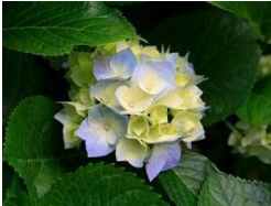
Abbildung 1: Blume.

Beachten Sie die Urheberrechte, wenn Sie Fotos aus dem Internet entnehmen.